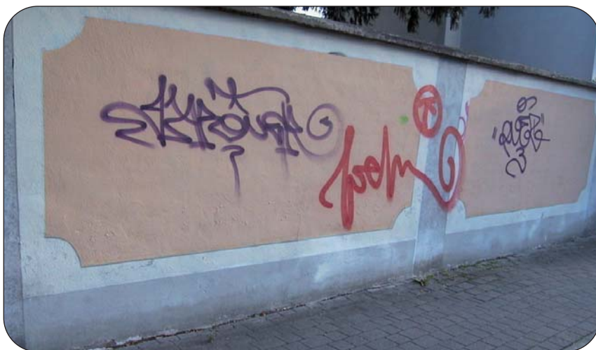
I muri dell'oratorio sono ridotti in queste condizioni