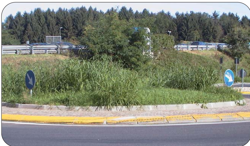
piazza Borgia: doveva essere ultimata un anno fa